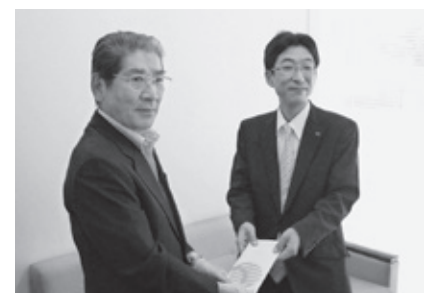
8/5 (株)オータ プロ野球招待券の寄付