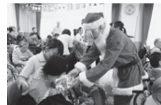
12/1 善意銀行サンタ袋菓子贈呈