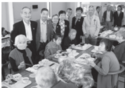
10/29 豊橋寿司組合 つつじ荘を慰問