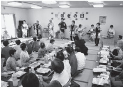
9/15 伊藤民謡会 敬老会で民謡を披露

大久保浩・二三子 3,000円 三の輪ゴルフ(株) 100,000円 赤岩荘秋祭り 100,000円 介護老人保健施設赤岩荘 11,249円