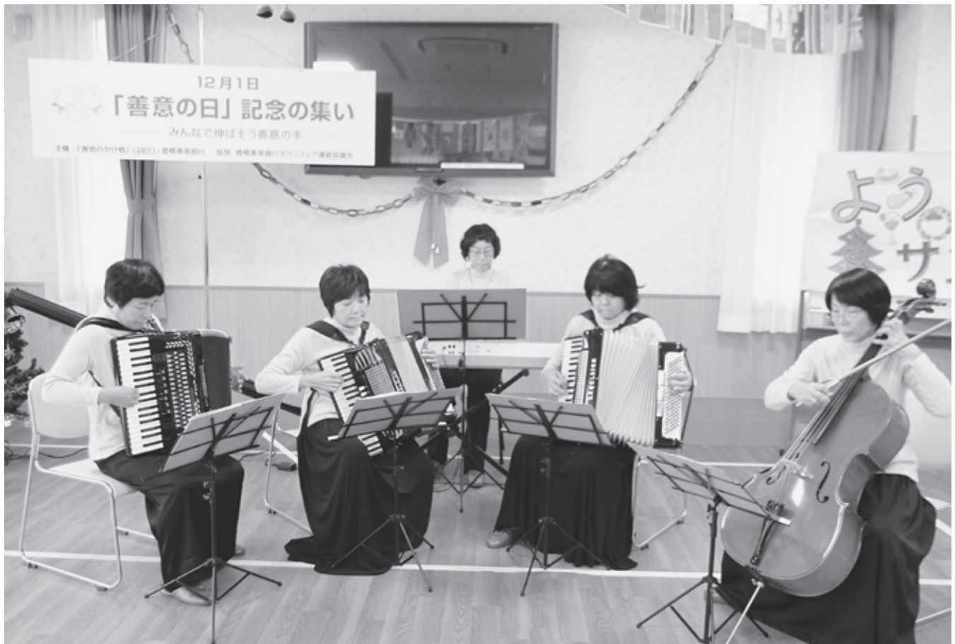
12/1「善意の日記念の集い」で演奏するアンサンブルコスモス