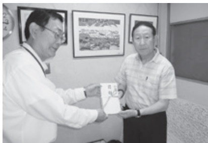
7/2 夜店を守る会 売上金の寄付

本行は、昨年より特定公益増進法人になりました。寄付金・維持会費等は特定寄付金として扱われ、個人の寄付に対しては所得税法の寄付金控除が認められ、会社等の法人に対しては一般寄付金の損金算入限度額とは別に、法人税法上の特別損金算入限度額が認められています。(※寄付金を損金に算入するには、確定申告書にその金額を記載し、寄付金の明細書を添付するとともに、所定の書類を保存している必要があります。)