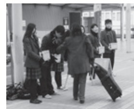
12/16 高校生善意ナベ募金

(※1) 利用金額は価格サービス、材料費、その他で、人数×一人当(円)とは異なる場合があります。 (※2) 啓発費・印刷費・送料等事務費含まず。受入金との差額は、福祉施設等今年度入進学卒業児童の祝事業等に充たす。