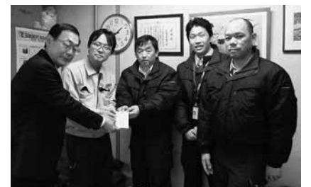
12/15 日東電工(株)豊橋事業所・労働組合寄付

寿司蔵岩田店 164円 豊橋信用金庫中央支店 2,345円 豊橋信用金庫田原支店 1,003円 蒲郡信用金庫田原支店 1,115円 車寿司本店 786円 豊橋ケーブルネットワーク(株) 4,748円 ガステックサービス(株) 12,140円 内藤建材店 3,497円 豊橋信用金庫下地支店 777円 中部電力(株)豊橋営業所 7,660円 豊地区民生委員児童委員協議会 4,654円 愛知県三河港務所 2,131円 東三河廃棄物処理事業協同組合 2,294円 豊国工業(株) 10,458円 蒲郡信用金庫岩田支店 578円 蒲郡信用金庫南栄支店 3,654円 らーめん工房善の家 26,701円 精文館書店南店 6,638円 喫茶マルシェ 11,258円 八木歯科医院 1,733円 中部歯科医院 569円 (株)三松館 1,172円 菅谷歯科医院 1,772円 宮地歯科医院 159円 藤井歯科 311円 エイブルネットワーク豊川駅東口店 6円 エイブルネットワーク豊川中央店 27円 ジャンファン 3,533円 山口歯科医院 230円 川島歯科医院 599円 大竹内科 4,912円 鈴木歯科クリニック 1,119円 豊橋商工信用組合田原支店 149円 蒲郡信用金庫豊橋支店 9,070円 豊橋商工信用組合二川支店 536円 豊橋商工信用組合東田支店 1,518円 Cocotte 2,334円 野村證券(株)豊橋支店 8,289円 吉村鍼治療院 1,192円 アーチャーラ 7,929円 豊橋商工信用組合本店 192円 豊橋商工信用組合赤羽根支店 2,419円