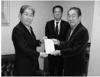
12/15 とよしん牛川つづじ会ゴルフ部会寄付