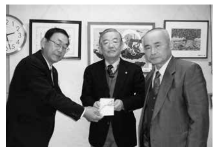
12/5 豊橋保護区保護司会寄付