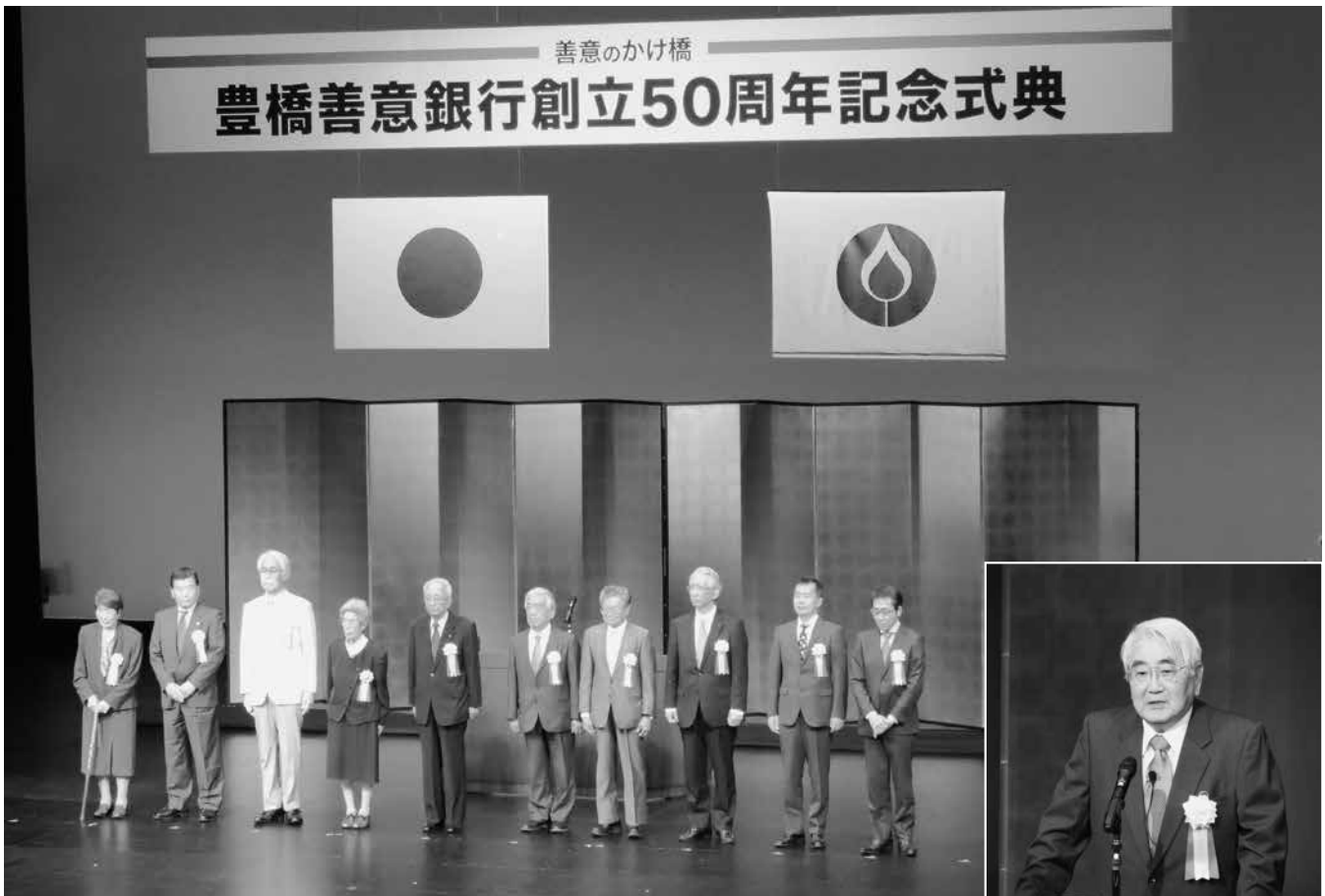
4/25 公益財団法人豊橋善意銀行創立50周年記念式典表彰者