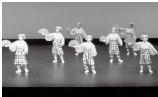
日本民謡研究会東三支部