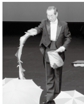
豊橋マジッククラブ