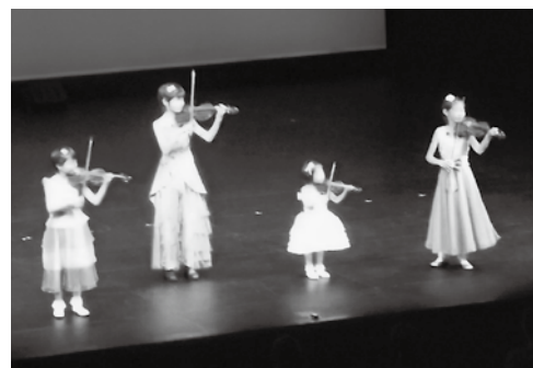
わかさキッズアンサンブル