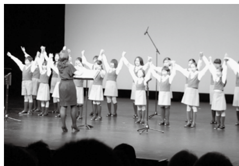
豊橋少年少女合唱団

また、第二部では特別芸能大会を上記チャリティー芸能大会実行委員八社中が参加で開催した。