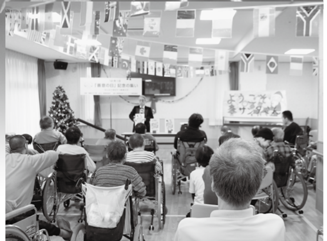
12/1「善意の日」記念の集いマジック披露

*具体的な呼びかけは、12月1日の広報とよはしと一緒に回覧の 年末たすけあいのチラシの中に載せお届けさせていただきます。