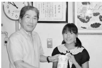
7/24 牛川小学校計画運営委員会寄付