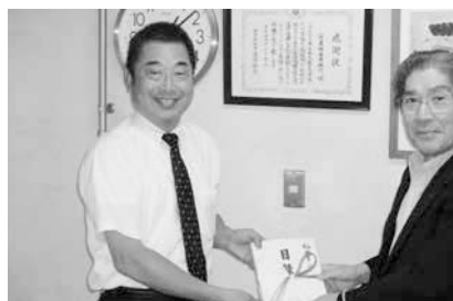
6/15 ホテルシーパレスリゾートプール券寄付