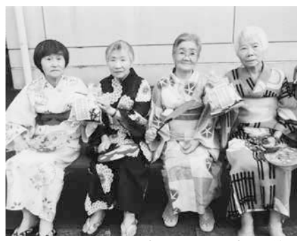
9/2 老人ホーム盆踊り大会にお菓子詰め合わせ貸付

豊橋善意銀行では、物品等を提供(贈呈)することを貸付と呼んでいます。四月から九月までの上半期での貸付は、福祉施設四件、福祉団体十四件、公官庁四件、その他四件で合計二十六件でした。貸付品は、預託物品の日用品を活用したのが十二件。品物を購入して貸付したのが十四件でした。品物を購入した金額は、二九二、二五〇円を活用した。