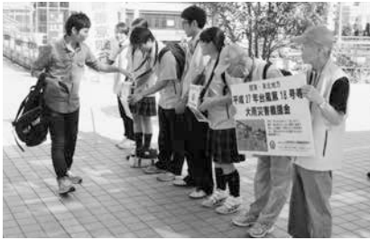
9/19 台風第18号等大雨災害募金実施