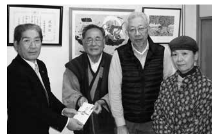
11/24 豊橋作陶協会チャリティー売上金を寄付