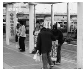
12/1 善意の日街頭募金

(※1) 利用金額は価格サービス、材料費、その他で、人数×一人当(円)とは異なる場合があります。 (※2) 受入金額と活用金額の差額は、福祉施設等今年度小学校入学児童、中学校進学及び卒業生徒の祝品事業に充当。