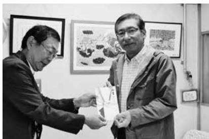
11/2 三菱レイヨン株豊橋事業所・ユニオンが募金寄付