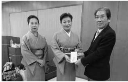
12/11 おおぎ和装学院年末たすけあい寄付