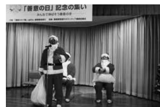
12/1 善意銀行サンタ理事長挨拶