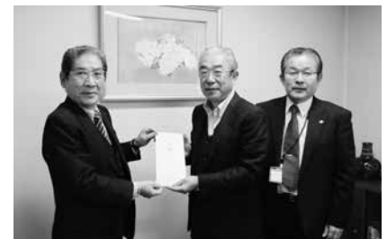
12/4 第47回豊信牛川つつじ会ゴルフコンペ募金寄付