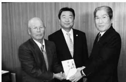
12/8 JA豊橋チャリティー売上金を寄付