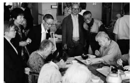
10/21 豊橋寿司組合が総合老人ホームつつじ荘に寿司慰問