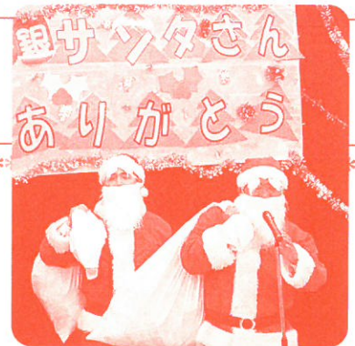
昨年の「善意サンタ施設訪問」