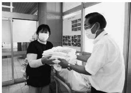
10/14 JA豊橋女性部会寄付