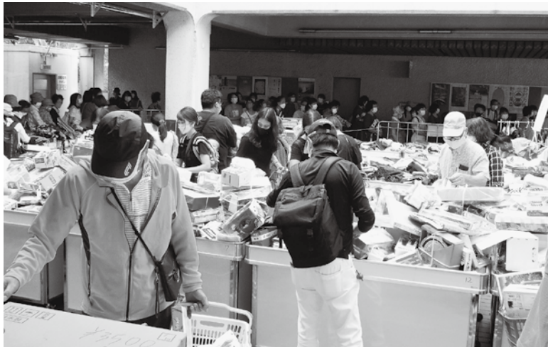
チャリティーバザー会場