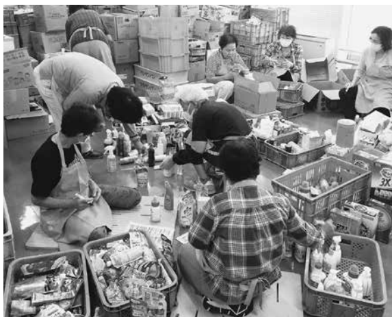
チャリティーバザー値付け

町自治会◇小畷町自治会◇前田町2丁目自治会◇前田町1丁目自治会◇吉田町自治会◇舟原町自治会◇前田町自治会 《杉山校区》◇杉山町自治会 《高山校区》◇高山校区自治会 《鷹丘校区》◇忠興町自治会◇東小鷹野1・2丁目自治会◇東小鷹野3・4丁目自治会◇西小鷹野町自治会 《高師校区》◇上野町自治会◇高師町自治会◇西高師町自治会◇畑ヶ田町自治会◇新高師町自治会◇浜道町自治会◇松並町自治会◇三本木町自治会 《高豊校区》◇東七根町自治会◇西七根町自治会◇伊古部町自治会◇東赤沢町自治会◇西赤沢町自治会◇城下町自治会 《玉川校区》◇石巻本町馬越自治会◇石巻本町長楽自治会◇石巻本町和田自治会◇石巻本町高井自治会◇石巻本町神ヶ谷自治会◇森岡町自治会◇東森岡町自治会 《谷川校