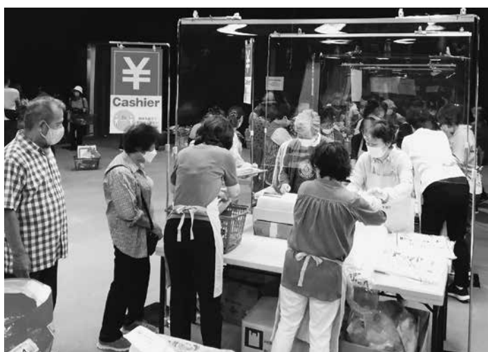
チャリティーバザー会計

◇瓦町三區自治会◇瓦町四區自治会◇瓦町五區自治会◇東瓦町一區自治会◇東瓦町二區自治会◇第一向山町一區自治会◇第一向山町二區自治会◇第二向山町自治会◇向山町自治会◇東向山町一區自治会◇東向山町二區自治会◇東向山町三區自治会◇向山東町自治会 《牟呂校区》◇中村町自治会◇公文町自治会◇三郷町自治会◇市場町自治会◇外神町自治会◇坂津町自治会 《豊校区》◇西岩田自治会◇春日町自治会◇三ノ輪町二區自治会◇三ノ輪本町自治会◇東三ノ輪町自治会 《吉田方校区》◇五号町自治会◇青竹町自治会◇吉前町自治会◇三ツ相町自治会◇野田町自治会◇新栄町自治会◇吉川町自治会