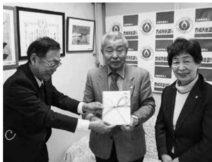
豊橋保護区保護司会が寄付