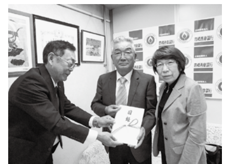
(公社)豊橋市シルバー人材センターが寄付