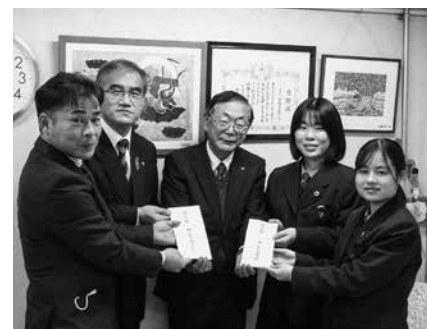
藤ノ花女子高校が収益金を寄付