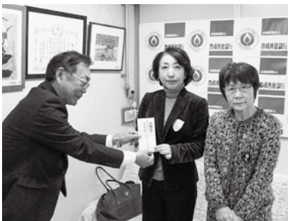
国際ソロプチミスト豊橋が寄付