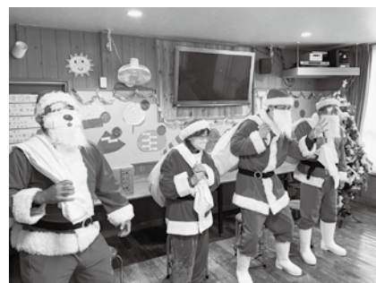
善銀サンタ施設訪問