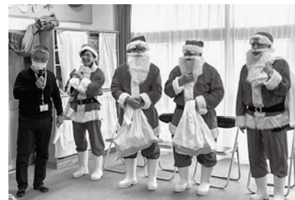
善銀サンタ施設訪問