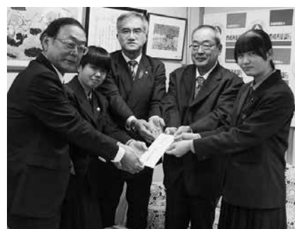
藤ノ花女子高校が収益金を寄付