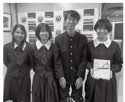
豊橋南高等学校生徒会が寄付