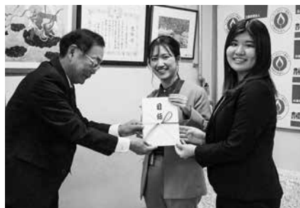
サーラフィナンシャルサービス㈱が寄付