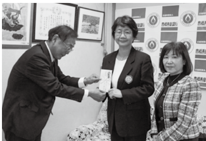
国際ソロブチミスト豊橋が寄付