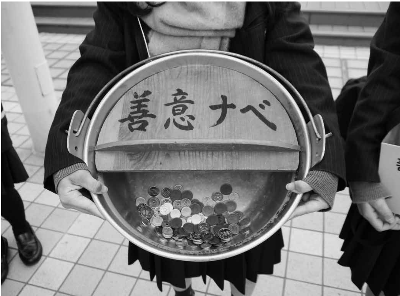
善意ナベ募金活動(なべを持ちながら募金を呼びかける高校生)