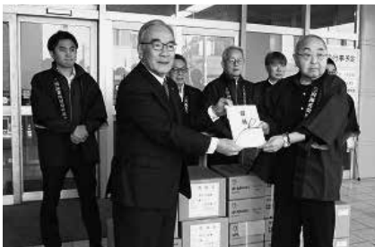
三河海苔問屋協同組合が寄付