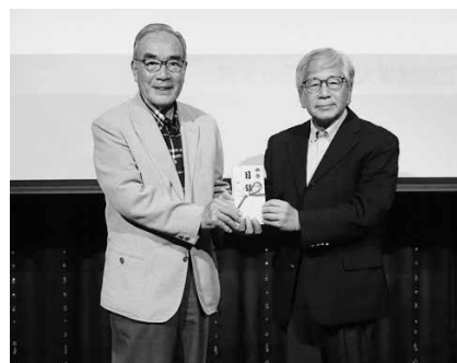
12大学対抗ゴルフ大会寄付