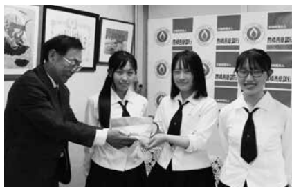
豊橋南高校生徒会寄付