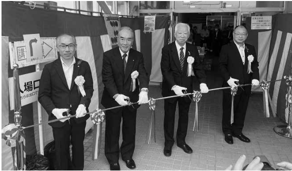
チャリティーバザーテープカット

自治会◇東小鷹野三・四丁目自治会 《玉川校区》◇森岡町自治会 ◇石巻本町高井自治会◇石巻本町神ヶ谷◇石巻本町長楽自治会 ◇石巻本町馬越自治会◇石巻本町和田自治会◇東森岡町自治会 《豊校区》◇三ノ輪町二区自治会◇三ノ輪本町自治会◇春日町自治会◇西岩田町自治会《牟呂校区》◇外神町自治会◇公文町自治会◇坂津町自治会◇三郷町自治会◇市場町自治会◇大西町自治会◇中村町自治会《野依校区》◇野依町自治会◇若松町自治会◇野依台二丁目自治会《賀茂校区》◇賀茂校区自治会◇賀茂町鶴巻町自治会《小沢校区》◇寺沢町自治会《大崎校区》◇大崎町自治会◇船渡町自治会《二川校区》◇二川校区自治会《津田校区》◇津田校区自治会