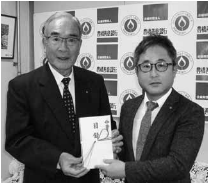
(一社)東三河法人会青年部会寄付