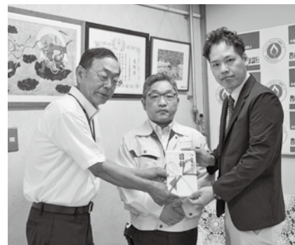
一幸建設安全協会寄付