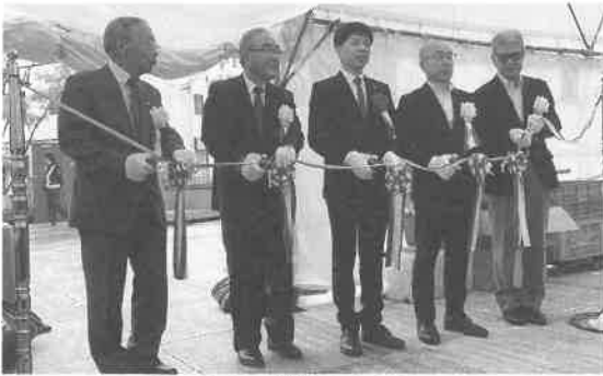
チャリティーバザーテープカット

百度町自治会◇北側町自治会◇ 稲場町自治会 《羽根井校区》◇ 羽根井本町自治会◇羽根井元町 自治会◇野黒町自治会◇立花 町自治会◇白河町自治会◇花中 町一区自治会◇花中町二区自治会 ◇中郷町自治会 《下地校区》◇ 下地校区自治会 《大村校区》◇ 大村校区自治会 《津田校区》◇ 津田校区自治会 《吉田方校区》 ◇五号町自治会◇吉前町自治会 ◇新栄町自治会◇吉川町自治会 ◇高洲町自治会◇三ツ相町自治会 ◇馬見塚町自治会 《牟呂校区》 ◇中村町自治会◇大西町自治会 ◇公文町自治会◇市場町自治会 ◇三郷町自治会 《汐田校区》 ◇松島町自治会◇東脇町自治会 《高師校区》◇上野町自治会◇ 新西高師町自治会 《芦原校区》 ◇西高師町自治会◇高師町自治 会◇芦原町自治会◇新芦原町自