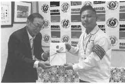
武蔵精密工業株式会社武友会寄付