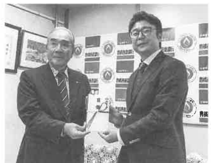
(一社)東三河法人会青年部会寄付